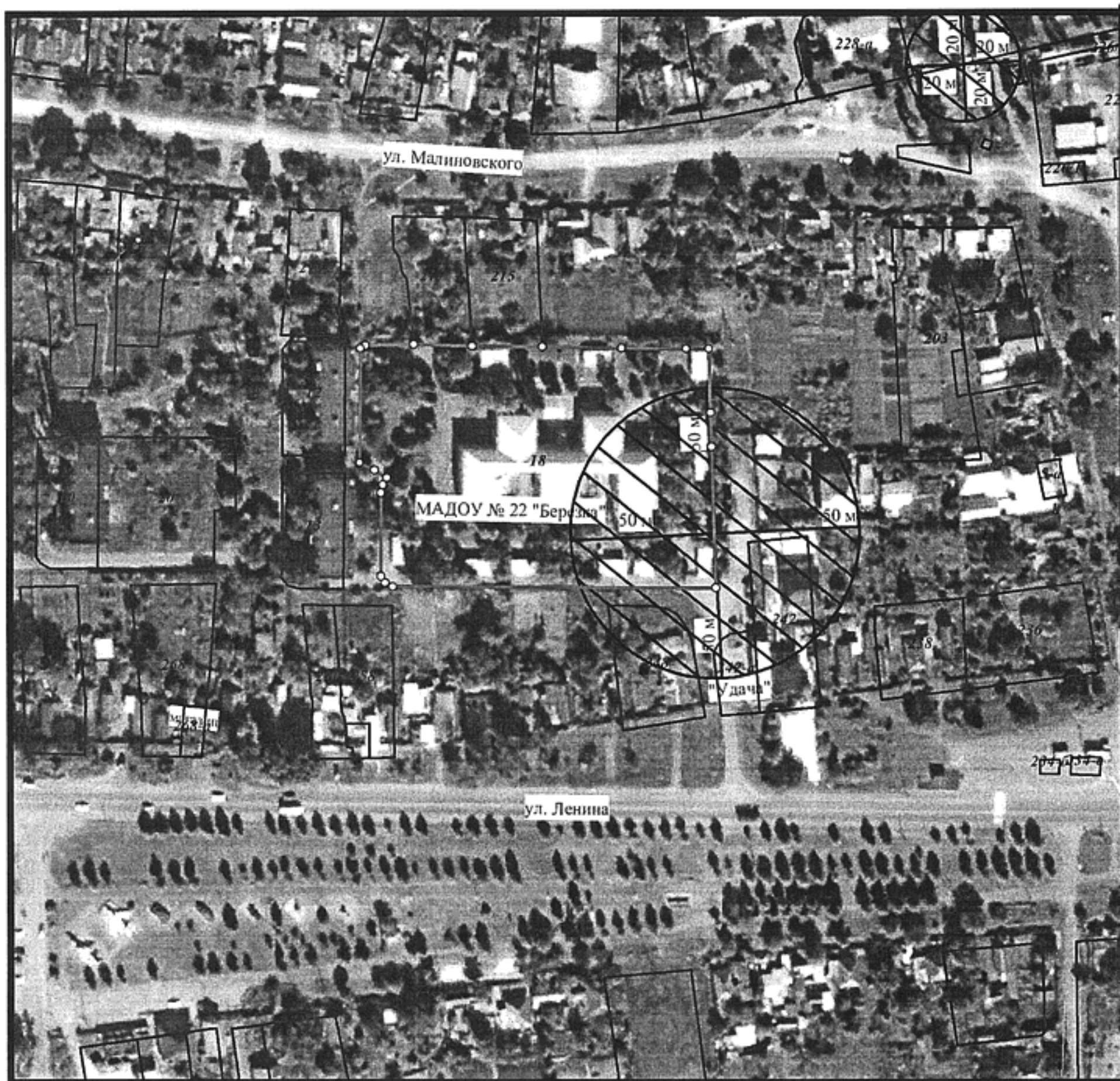
Схема границ прилегающих территорий № 50 М 1:2000

Расстояние радиусом 50 м от входа МАДОУ-ЦРР д/с № 22, расположенный по адресу: ст. Кавказская, ул. 60 лет СССР, 18