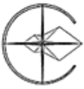
Схема границ прилегающих территорий № 79